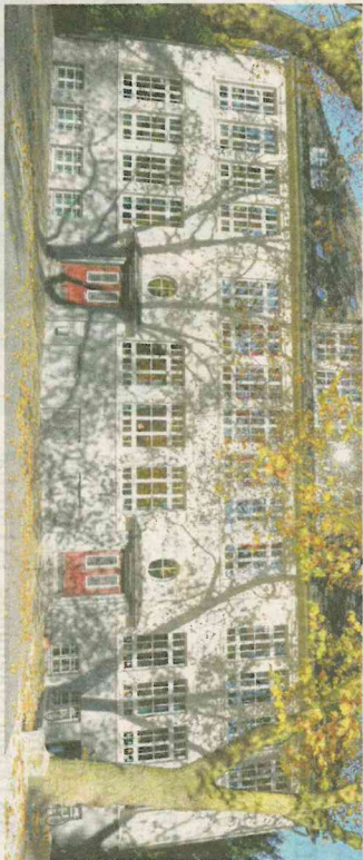
An der Martinschule können beim Mitmach-Tag kleine Beuscher Blumenwiesen anlegen und Zäune bepflanzen.

So können etwa verschiedene Blumenwiesen angelegt und Zäune bepflanzt werden. Dazu gibt es Informationen und Anleitungen, um das Gartenkraut Kresse selber auszusäen und schmackhaften Kressequark